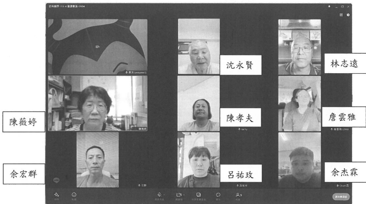
出席會議委員截圖：