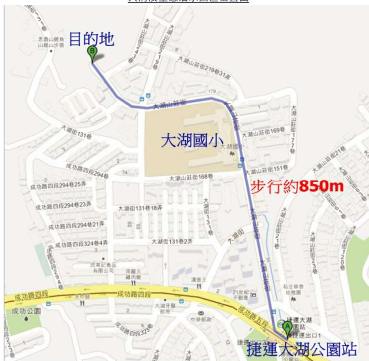
大溝溪生態治水園區位置圖

◆捷運-搭乘捷運「文湖線」於「大湖公園站」下車，走 1 號出口，由大湖山莊街進入，經大湖國小後，便達目的地。